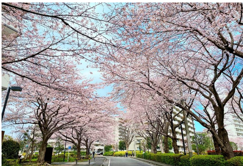
〈2022年3月28日撮影:レッスン場のマンションの桜〉

今年も、レッスン場をお借りしているプラザシティの桜が見事な花を咲かせていました。思わず写真を撮る私。iPhoneで撮ったにしてはなかなかうまく撮れた気がします、どうでしょう？(笑) さて、ゴールデンウィークの営業は右記の通りです。バレエ教室も同様です。今年は10連休になる方もいるようですね。楽しいゴールデンウィークをお過ごしくださいませ。